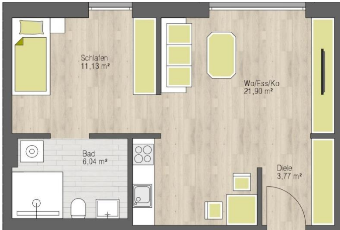
Beispiel einer 2-Zimmer-Wohnung