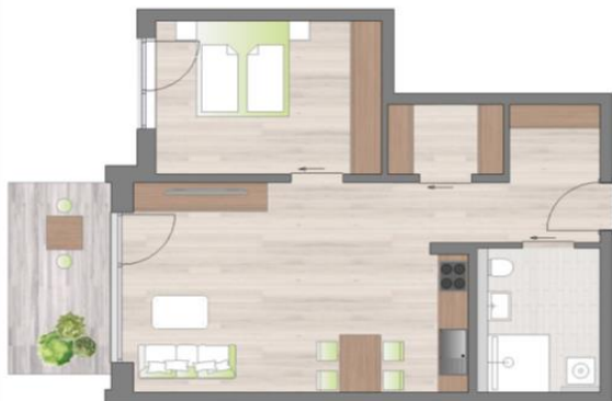
Beispiel einer 2-Zimmer-Wohnung

Das Seniorenwohnen bietet für ältere Menschen unabhängig von Krankheit oder Alter, die in einem altersgerechten Wohnkonzept mit höchstem Maß an Selbstbestimmung und Unabhängigkeit leben möchten. Ebenso für Alleinstehende, Ehepaare oder befreundete ältere Menschen, die in einem guten Serviceumfeld gemeinsam ihren Lebensabend verbringen.