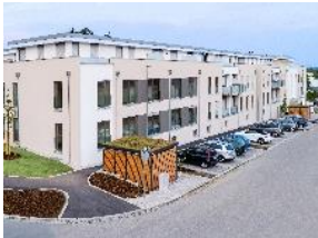
Betreutes Wohnen im Seniorendienstleistungszentrum Brentanostraße