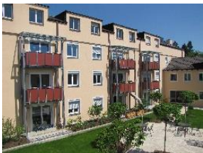
Betreutes Wohnen am Mariahilfberg