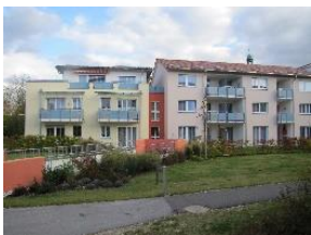
Betreutes Wohnen St. Sebastian

Für Beratung und ein persönliches Gespräch sind wir gerne für Sie da